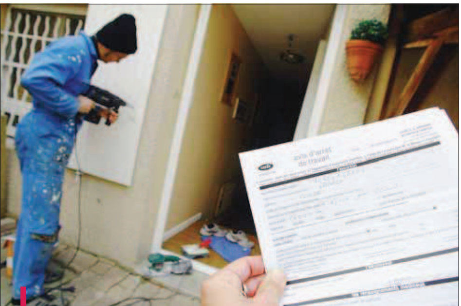
219 071 accidents du travail concernant 1 374 333 salariés ont été enregistrés en 2008. Le BTP est le secteur le plus accidentogène: 77,8 accidents pour 1 000 salariés.