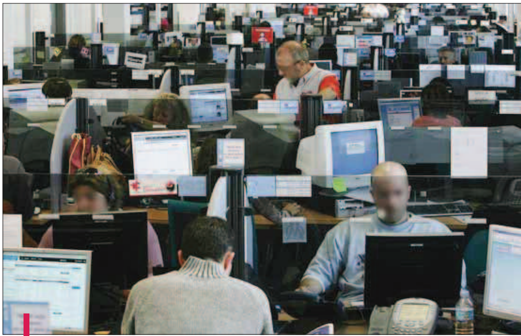
Selon un sondage CSA réalisé fin mars 2009, en prélude à la semaine de la qualité de vie au travail, plus de 4 salariés sur 10 déclarent souffrir de stress au travail.

Le "Plan Darcos", lancé dans la foulée des vagues de suicides qui ont fait l'actualité, a conduit les plus réticents à enfin prendre en compte ces questions. Pour répondre à la demande, Capital Santé et IN-Communication ont développé des outils